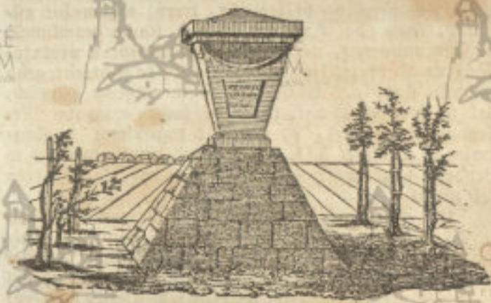
(Hrob maršálka Swerina.)

W takowýchto obědnicech obyčejně wšeliké druhy pokrmy, zwáště pak pečeného a wareného masa, každému gsau na wšbor. A masu Angličané newojce zemčat sobě libugi: mřno to každého dne mřkew, saláty atd., pohotowě gsau. Potomně následuge gestě s tak nazwaným pudlingem, t. zwáštstwjmi Angličanům oblíbenými knedličky, weliké množstwj rozličných pastel a dortů, z nichž tyto owocem, onyno pak masem naplněny gsau. Oblíbené pečimě Angličanů gsau mladá lodyhy rewenj (rabarbarj) na drobno strágené a s gablky do dortů zadelané. Po pečiwu obyčejně požíwá se kausel syra, škywa chleba s máslem a šarowým celerentj; k nápojgi pak slauzi naderowšsedo silné pivo, obyčejně z newbljžšj šenkowny wřináššino. Štu podiwu gest, gak bystrau paměť ty posluhugjci děwecly wladnau. Nědokoli šgednau w těchto obědnicech obědwal, žádá-li třebas po měšci téhož masa, gehož předtjm tam požíwal, i hned se rozpomjmagj na geho oblíbené kusy, tolikž libugeli tluště nebo netluště atd. Nadto, třebas ly beset hostj swě pokrmy pogednau u nich obgednalo, zřjda šty w čem se dšybj.